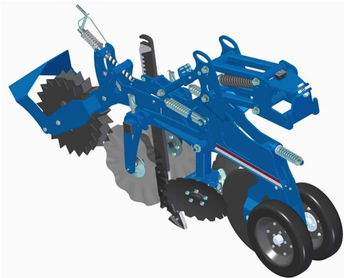
Modèle COLZA – BETTERAVE